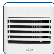
Alette regolabili in senso verticale Vertically adjustable flaps