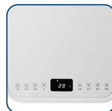
Pannello comandi touch con display a LED Touch control panel with LED display