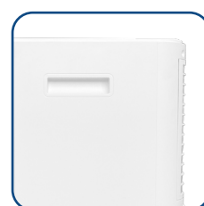
Pratiche maniglie laterali Useful side handles